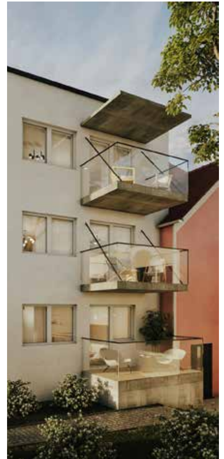
8010 Graz, Plüddemangasse 15