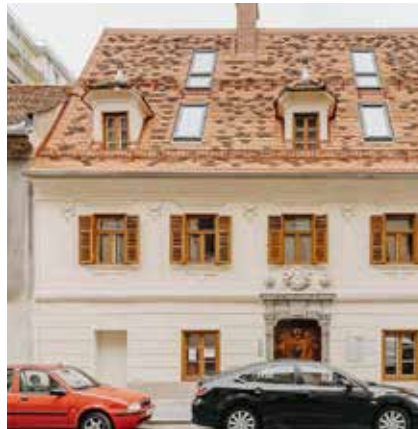
8020 Graz, Strauchergasse 20