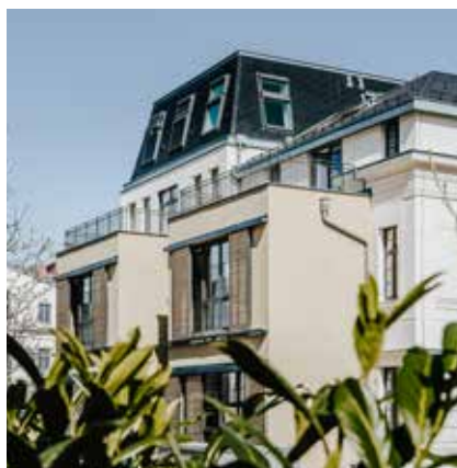
1160 Wien, Montleartstraße 1a