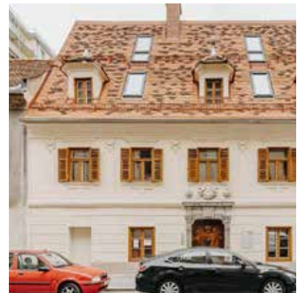
8020 Graz, Strauchergasse 20