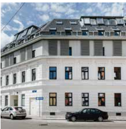
1210 Wien, Anton-Anderer-Platz 6