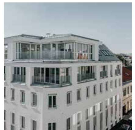
1170 Wien, Bergsteiggasse 47