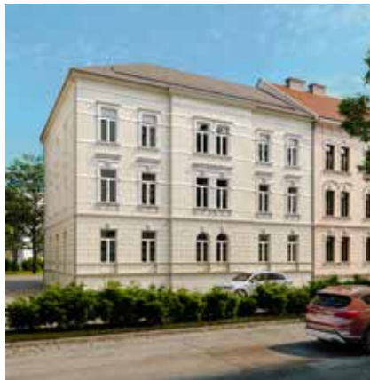
9020 Klagenfurt, Koschatstraße 10