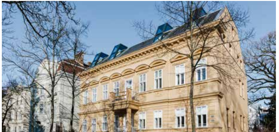
1140 Wien, Hüttelbergstraße 12