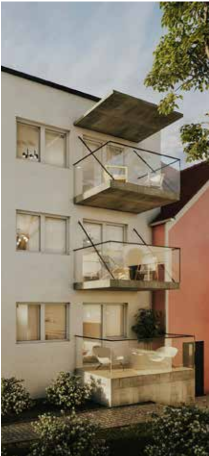
8010 Graz, Plüddemanngasse 15

wohninvest hat über 60 Immobilienprojekte österreichweit erfolgreich abgewickelt. Mehr als 600 Investoren profitieren bereits von der Wertschöpfung ihrer Projekte.